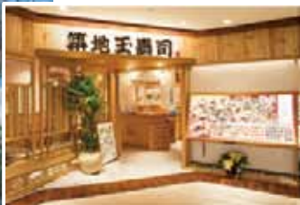
8楼「筑地玉寿司」餐馆