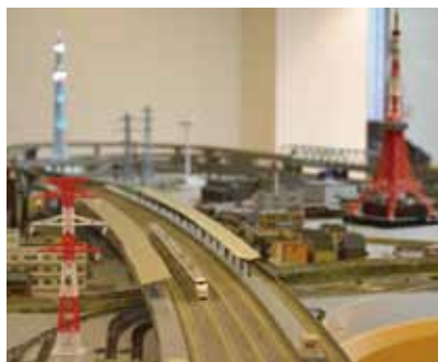
列车模型能实际运行的巨大的立体展示装置, 看看也很好玩。