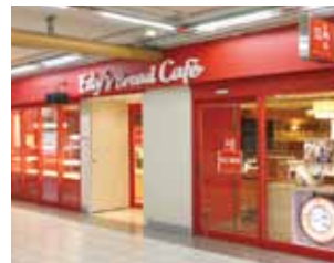
醒目的红色招牌。设置了完全分烟区(46个禁烟座位·30个抽烟座位)