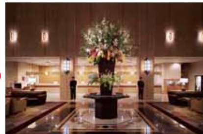
宽敞高大的酒店大堂