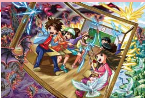
新游玩景点“神奇的体验!魔法学校”(参考图)