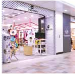
为每天忙碌的女性而建的只有Echika才有的时装杂货区。