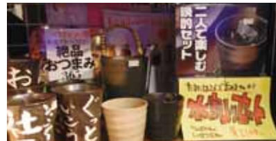
把日本的酒器作为礼品怎么样?