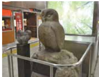
池袋车站内的“猫头鹰”像

此外，猫头鹰（FUKUROU）的发音接近日语“幸福”（FUKU）的发音，所以“猫头鹰”像还是幸福的象征。