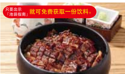
本馆8楼的“HITSUMABUSHI 备长”(鳗鱼饭)餐厅