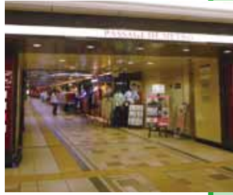
以“池袋蒙帕纳斯”为理念，充分活用了充满艺术和文化气息的池袋街道的车站地下设施。