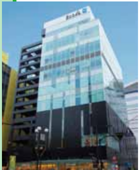
时隐时现的以黑色为基调的I型设计。