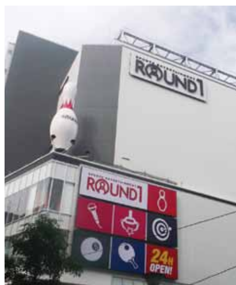
位于太阳60街的中心, 醒目的大保龄球标志。