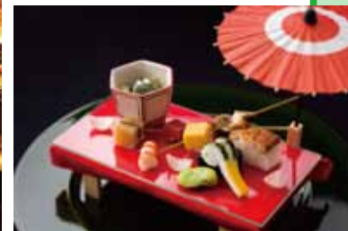
请品尝使用了四季时鲜食材的传统日本佳肴 日本料理「花MUSHASHI」