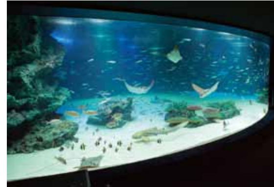
充满南国大海气息的水池, 一片蔚蓝的世界。