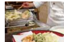
厨师在您的眼前鲜炸的天妇罗。