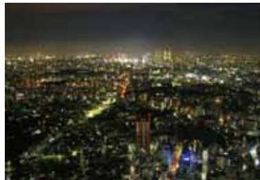
高楼林立, 闪耀明亮。

巨大的360°的天穹在海拔251米的高空中展开。天气条件好的话能遥望到富士山。美丽的夜景也值得推荐。