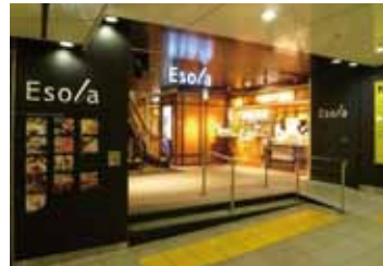
由于与池袋站直接连接着，即使是下雨天不用打伞也能购物。