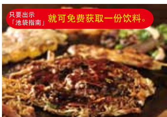
本馆8楼的“神户六甲道 GYUNTA”(杂粮煎饼、炒面、铁板烧)餐厅