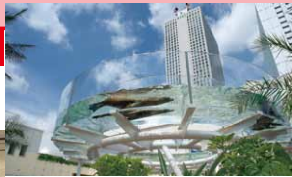
海狮在空中飞翔遨游的“太阳水轮”。