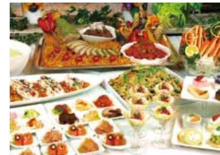
在美食丰富的自助餐厅里, 男女老少都可尽情享受用丰厚的美食。