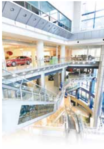
从地下1楼~4楼，丰田汽车阵容庞大。