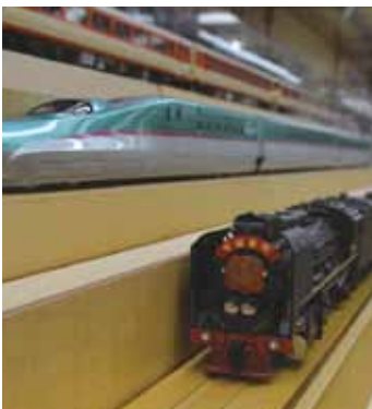
东北新干线E5型“猎鹰”和中国蒸汽机车头前进型“毛泽东号”