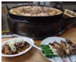
请品尝肉烧豆腐和烤猪肉。