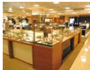
6楼的8-10番地的“钟表沙龙”