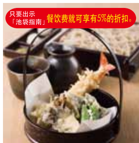
本馆8楼的“居荞麦屋 信州”(荞麦居酒屋)