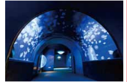
在海蜇隧道, 仿佛被海蜇包围了。