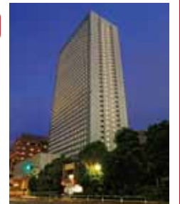
位于池袋的地标【复合都市太阳城】内的楼高38层的酒店。