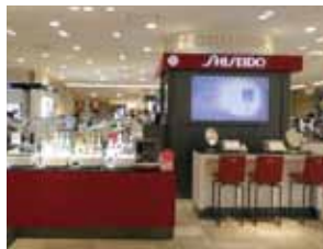
去年化妆品销售区重新装修。2楼是日本国内的47家品牌店铺，3楼是新开的6家美容院。

与池袋车站直接连接着，便于出入。日本国内的有名品牌聚集。拥有「三丽鸥店」、「东京天空树认证的商品」等，只有池袋东武店才有的购物乐趣。