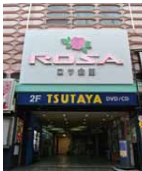
玫瑰LED看板是西池袋的象征。