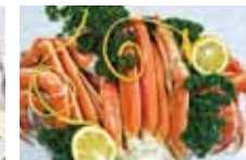
自助晚餐, 您可以畅食雪蟹。