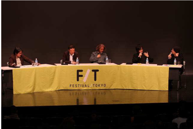
F/T10 "F/T Symposium"