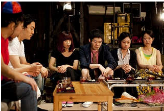
“Old Air Conditioner ” (F/T10, 2010)