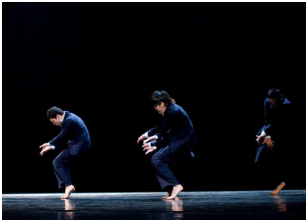
“Joker’s Blues”